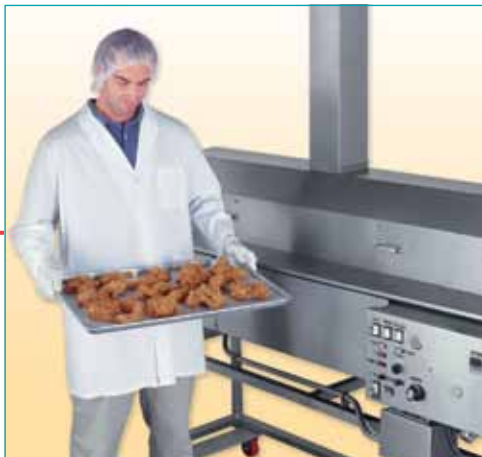
Los freidores compactos de sobremesa permiten a las cocinas institucionales preparar una variedad de alimentos requiriéndose un tiempo mínimo para hacer los cambios.

Visite nuestros Centros Técnicos para probar sus productos en el versátil Freidor Compacto Mastermatic.